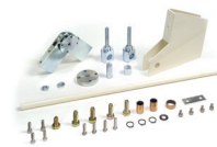
Kit articolazione - H max soffitto 3 m (solo per aste rettangolari standard)