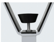
Vite di regolazione per supporto a forcella