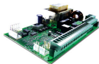
Scheda elettronica 624BLD (incorporata nell'automatismo) Info a pag. 165