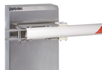
Tasca di fissaggio per asta tonda pivottante - (INOX)

Non è possibile utilizzare siepi, piedino e forcella in abbinamento alle aste tonde pivottanti.