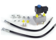
Gruppo antipanico ♦