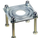
Piastra di supporto per forcella