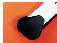
Tasca di fissaggio per asta rettangolare ♦

le aste rettangolari dispongono di un profilo di gomma antiurto; per una ragione di bilanciamento non è possibile installare sul profilo dell'asta delle coste di sicurezza "attive".