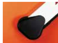
Tasca di fissaggio per asta rettangolare ♦

le aste rettangolari dispongono di un profilo di gomma antiurto; per una ragione di bilanciamento non è possibile installare sul profilo dell'asta delle coste di sicurezza "attive".