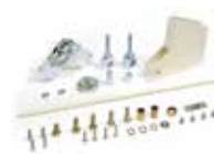
Kit articolazione - H max soffitto 3 m (solo per aste rettangolari standard)