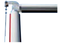
Kit articolata per asta tonda S (max 4 m)