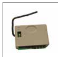
MODULI DI RADIOFREQUENZA RQFZ 3PIN per GENIUS. 433 MHz