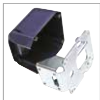
KIT STAFFA A MURO