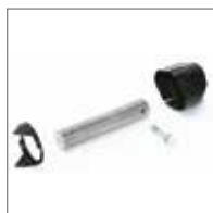
KIT BILANCIAMENTO Kit bilanciamento per asta Simple con lunghezza ridotta rispetto allo standard.