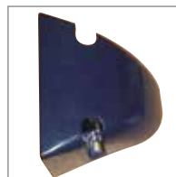
KIT SUPPORTO FOTOCELLULE Fotocellule Vega e Vision per kit basamento.