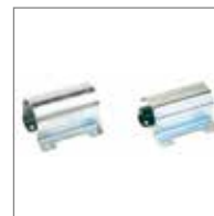
TASCA Tasca Ø 50 mm per aste 4 m.