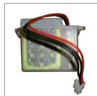
KIT BATTERIA Completo di scheda di ricarica.