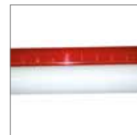
ASTA Telescopica Ø 50 - 4 m.