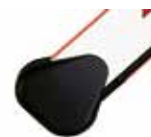
Tasca di fissaggio per asta rettangolare

le aste rettangolari dispongono di un profilo di gomma antiurto; per una ragione di bilanciamento non è possibile installare sul profilo dell'asta delle coste di sicurezza "attive".