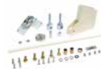
Kit articolazione - H max soffitto 3 m (solo per aste rettangolari standard)