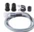
Kit collegamento luci asta