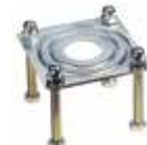
Piastra di supporto per forcella