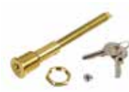
Serratura di sblocco con chiave personalizzata (dal n. 1 al n. 10)