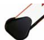
Tasca di fissaggio per asta rettangolare ♦

le aste rettangolari dispongono di un profilo di gomma antiurto; per una ragione di bilanciamento non è possibile installare sul profilo dell'asta delle coste di sicurezza "attive".