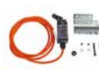
Sensore sfondamento per aste tonde pivottanti