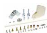
Kit articolazione - H max soffitto 3 m (solo per aste rettangolari standard)