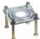
Piastra di supporto per forcella