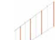
Kit siepe lunghezza 2 m ♦