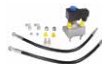
Gruppo antipanico ♦