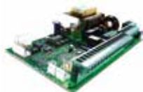
Scheda elettronica 624BLD (incorporata nell'automatismo)