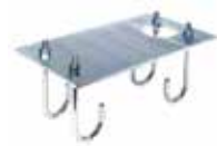
Piastra di fondazione