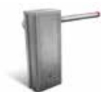
Cofano acciaio INOX