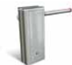
Cofano Grigio RAL 9006