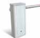
Cofano Bianco RAL 9010