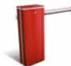
Cofano Rosso RAL 3020