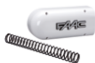
Tasca e molla di bilanciamento S