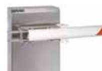
Tasca di fissaggio per asta tonda pivotante - (INOX)

Non è possibile utilizzare siepi, piedino e forcella in abbinamento alle aste tonde pivotanti.