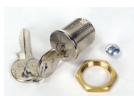
Serratura di sblocco con chiave personalizzata