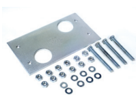
Piastra di fondazione con regolazioni laterali ed in altezza (confez. da 6 pz.)