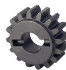
Pignone Z16 cremagliera