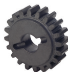
Pignone Z20 cremagliera