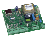
Apparecchiatura elettronica 578D (installazione remota) Info a pag. 156