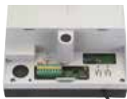
Scheda elettronica E600 incorporata Info a pag. 188