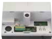
Scheda elettronica E1000 incorporata Info a pag. 188