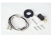
Kit Finecorsa singolo (apertura o chiusura)