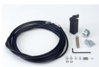
Dispositivo sblocco esterno con cavo e guaina Lunghezza 5 m ♦