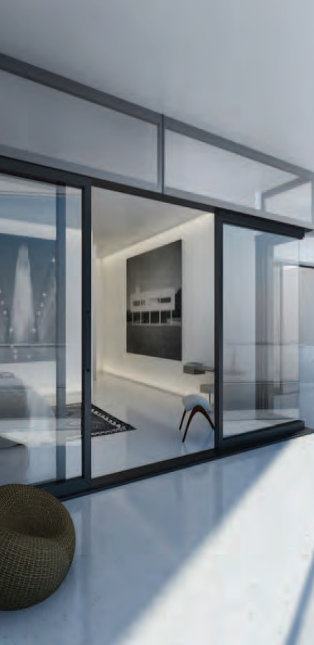
TWIN WS DM