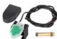
SAFEcoder encoder assoluto magnetico BUS (Brevetto FAAC)