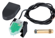
SAFEcoder encoder assoluto magnetico BUS (Brevetto FAAC)