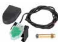
SAFEcoder encoder assoluto magnetico BUS (Brevetto FAAC)