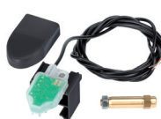
SAFEcoder encoder assoluto magnetico BUS (Brevetto FAAC)