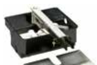
Cassetta portante con sistema di sblocco (Brevettato)