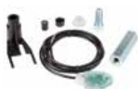
Gruppo encoder per 770N