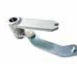
Kit apertura a 140°