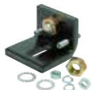
Arresto meccanico interno di apertura