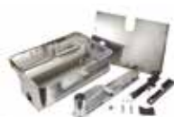
Cassetta portante in acciaio inox con sistema di sblocco (Brevettato)