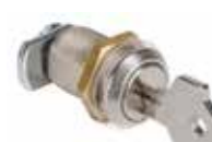
Serratura di sblocco con chiave personalizzata