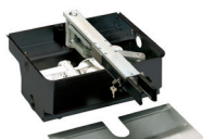
Cassetta portante con sistema di sblocco (Brevettato)