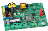
Scheda elettronica E045 Info a pag. 148