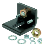
Arresto meccanico interno di apertura