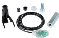
Gruppo encoder per 770N