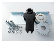
Kit apertura a 180°