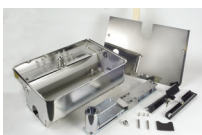
Cassetta portante in acciaio inox con sistema di sblocco (Brevettato)