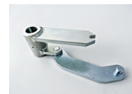
Kit apertura a 140°