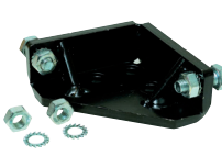
Arresto meccanico interno di chiusura