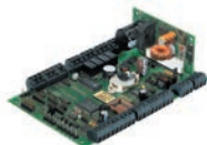
COBRA5000 plus con alim. stabilizzato e cont. LM (IP55) Info a pag. 299