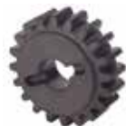
Pignone Z20 cremagliera