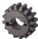
Pignone Z16 cremagliera