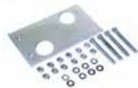
Piastra di fondazione con regolazioni laterali ed in altezza