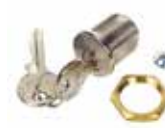
Serratura con chiave personalizzata 1-10