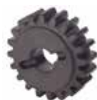
Pignone Z20 cremagliera