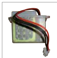
KIT BATTERIA Completo di scheda di ricarica.