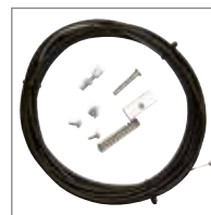
KIT SBLOCCO Da abbinare al contenitore ARMO