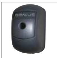
ARMO 24V Con dispositivo di sblocco e pulsante di comando.