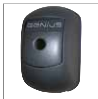
ARMO 230V Con dispositivo di sblocco e pulsante di comando.