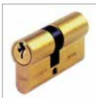
SERRATURA A cilindro per ARMO n. 1-10