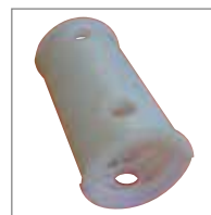
ADATTATORI PER ALBERO SERRANDA Adattatore per tubo 60/33 Per Shutter 15