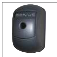
ARMO 24V Con dispositivo di sblocco e pulsante di comando.