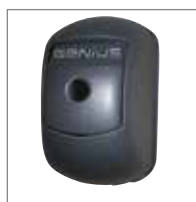
ARMO 24V Con dispositivo di sblocco e pulsante di comando.