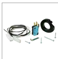
FINECORS Per battuta di chiusura o apertura per un motore.