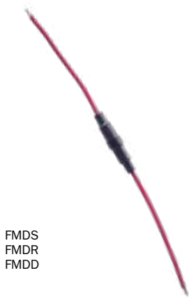
FMDS FMDR FMDD